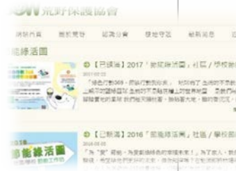
工研院與荒野協會節能志工