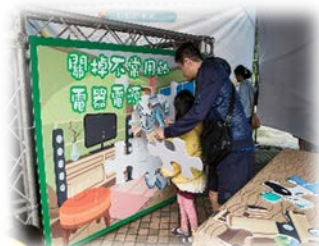
能源成果展示活動