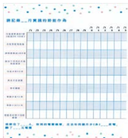
暑假用電 紀錄學習單